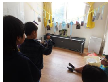
生きもの射的 (生きものクラブ)