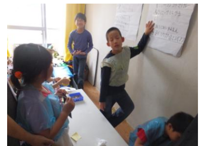
味覚実験 (実験クラブ)