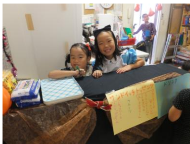
メイドカフェ (お料理クラブ)