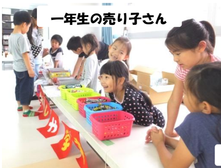
一年生の売り子さん