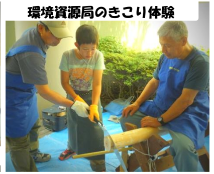
環境資源局のきこり体験