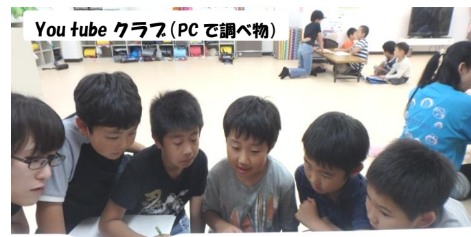
You tube クラブ (PC で調べ物)