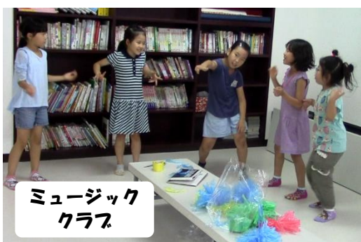
ミュージック クラブ