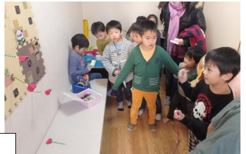
在籍児童は新一年生のおもてなし