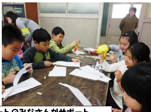
教育委員会の方、高校生ボランティア、横浜アクションポートのみなさんがサポート