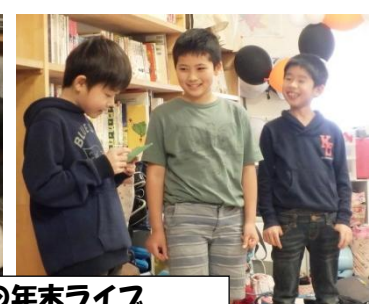
お笑いクラブの年末ライブ