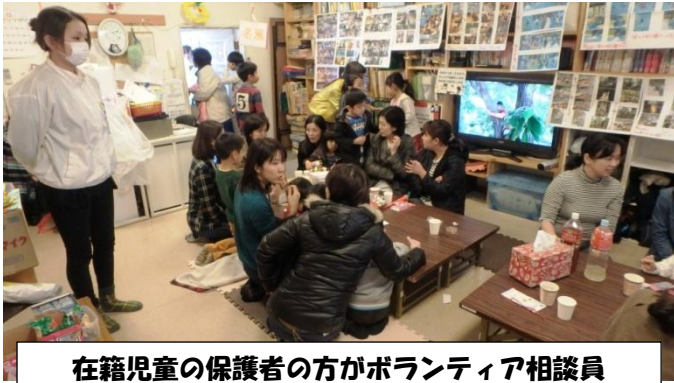
在籍児童の保護者の方がボランティア相談員