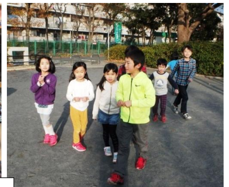
ゲームクラブの宝探し