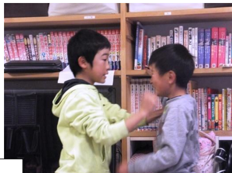
お笑いクラブの年末ライブ